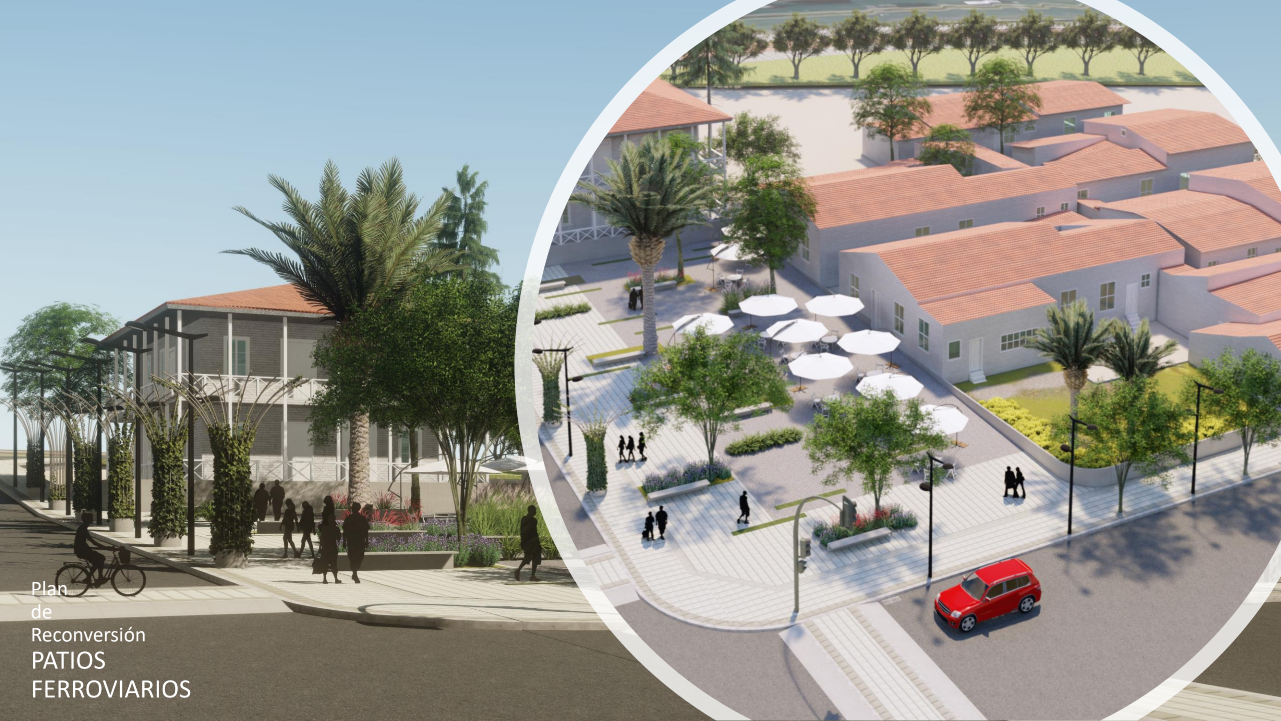
Plan de Reconversión PATIOS FERROVIARIOS