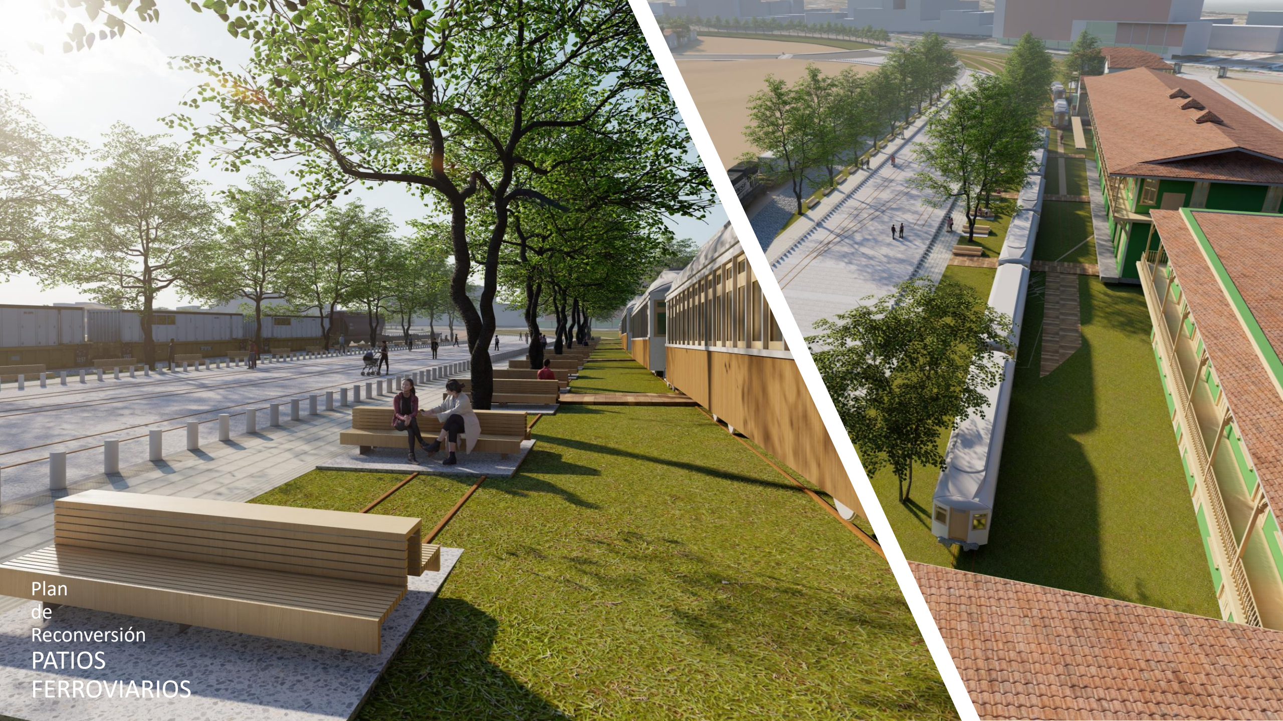
Plan de Reconversión PATIOS FERROVIARIOS